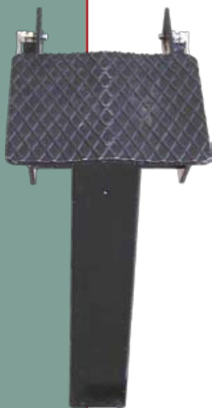
Расширение для раскалывающего клина