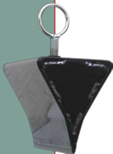
Расширение для раскалывающего клина

Колите дрова с помощью самого современного ножного управления!