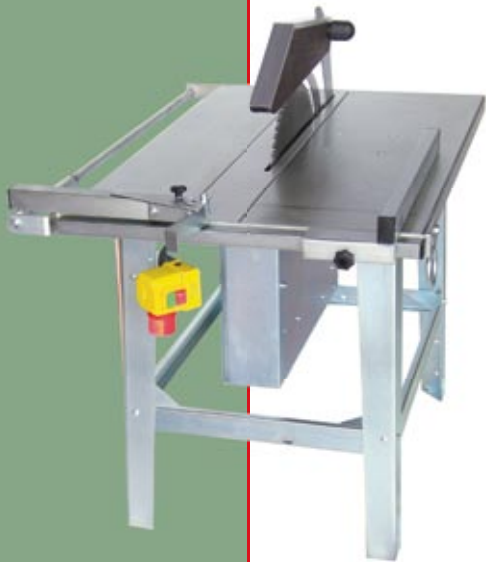
Baukreissäge BK 450 S, starr