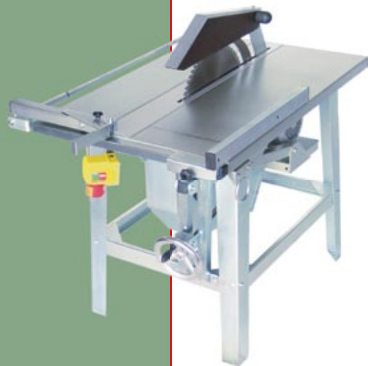
Baukreissäge BK 450 H, höhenverstellbar