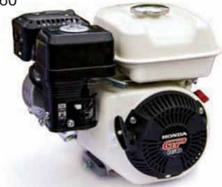
MOTOR HONDA GP 160